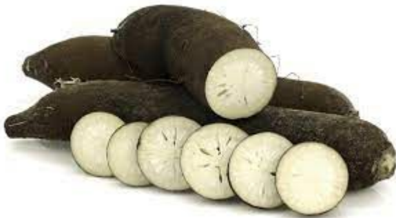
Le Radis noir