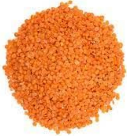
Les Lentilles corails