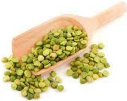
Les Pois cassés