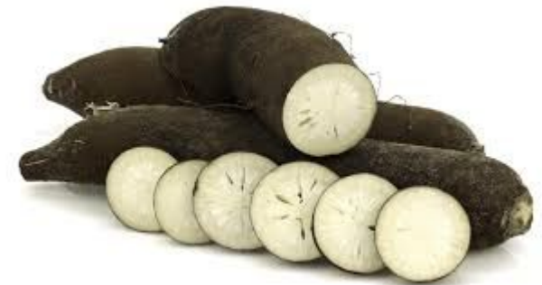
Le Radis noir