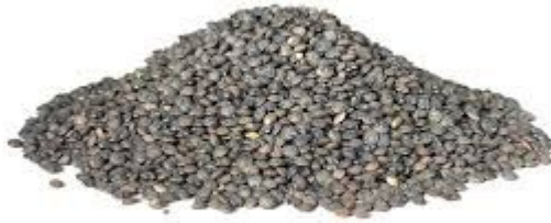
Les Lentilles vertes