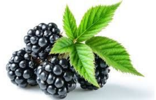
La Mure **