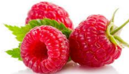
La Framboise **